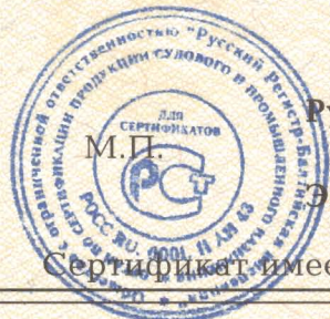
Схема сертификации За.